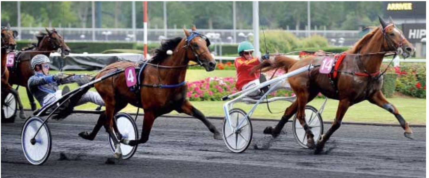
Sputtar till vinst gör utvändige Timoko i Prix Albert Viel (€200 000) i somras och plockar ner invändige Torino d'Auvillier.