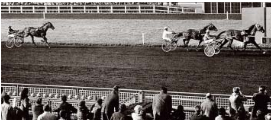
Vanina B tillhörde Frankrikes bästa hästar och vann massor med storlopp. Här kröner hon sin karriär med seger i Prix de France 1971 och besegrar Tony M och Toscan.

1961 segrade La Coulonces i Criterium Inter-