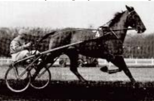
La Coulonces vann inte bara framför sulky. Hon vann också halvklassiska Prix Xavier de Saint Palais under sadel och tävlade även i passgång.

Bland hingstarna och valackerna var Gay Noon rekordsnabbast med 1.17,0 (1954) och det var självaste Ego Boy som var först i Sverige