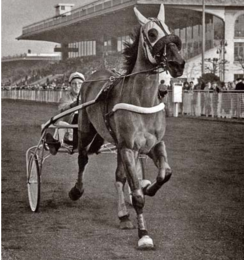
Vanina B hade en hel del att bråsa på som dotter till La Coulonces och hon ståtade med tio raka segrar när hon klev in i Prix d'Amérique 1971. Hon blev också mor till en annan stjärna, Jorky.