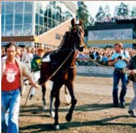
Två skötare krävdes det för att ta Jorky till Solvallas vinnarcirkel. I lopp var han däremot en gentleman.