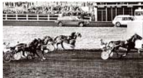
Utän chans var Vanina B i Prix d'Amérique mot den tidens stora stjärna Tidalium Pelo, men en andraplats var inte fy skam det heller.

Dramatiskt var det faktiskt redan inför loppet. Fransmännen var uppsuttna i volten och klara att köra ut på banan, men det tog ytterligare en kvart innan italienarna dök upp. När de väl infann sig blev fransmännen ur sina sulkyer och hotade med att inte deltaga i loppet. Vid den här tidpunkten var ofta fransmän och italienare i luven på varandra, vilket fick sin kulmen i Cagnes-sur-Mer.